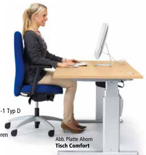
Abb. Platte Ahorn Tisch Comfort