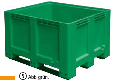
⑤ Abb. grün, Großbehälter mit Kufen, Höhe 760 mm, Wände und Boden geschlossen, Best.-Nr. 218 498, €/St. 299,-