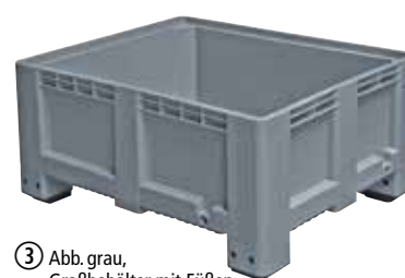
③ Abb. grau, Großbehälter mit Füßen, Höhe 580 mm, Wände und Boden geschlossen, Best.-Nr. 218 490, €/St. 269,-