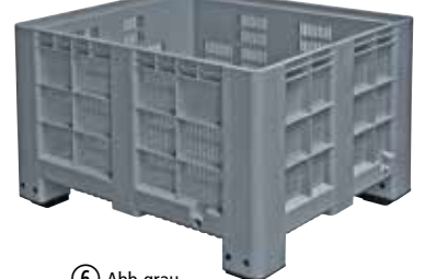
⑥ Abb. grau, Großbehälter mit Füßen, Höhe 760 mm, Wände und Boden geschlitzt, Best.-Nr. 116 246, €/St. 299,-