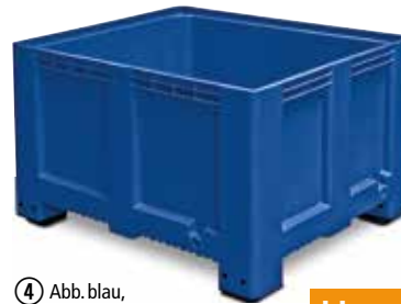
④ Abb. blau, Großbehälter mit Füßen, Höhe 760 mm, Wände und Boden geschlossen, Best.-Nr. 218 494, €/St. 279,-