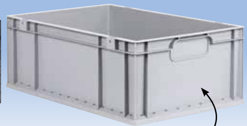
Abb. mit geschlossenem Griff

Verstärkter Boden ermöglicht eine schwere Beladung