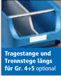
Tragegange und Trennstege längs für Gr. 4+5 optional