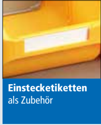
Einstecketiketten als Zubehör