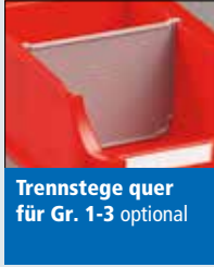
Trennstege quer für Gr. 1-3 optional