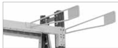
③ Drahttrenner mit Etikettenschild: aus Stahldraht, Ø 6 mm