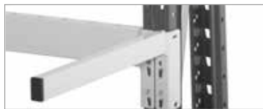
② Armtrenner: aus Profil-Stahl, 35x20 mm, max. 40 kg anliegende Last

① Vertikaler Bogentrenner ▶ aus Stahlrohr, Ø 20 mm, max. 50 kg anliegende Last, Höhe 750 x Länge 500 mm