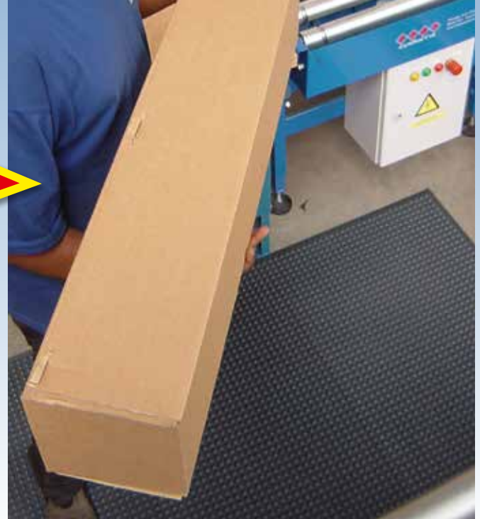
Entlastet Ihren Rücken und Beine bei langem Stehen