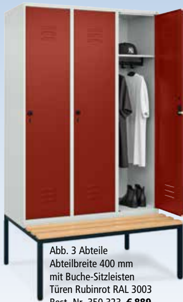
Abb. 3 Abteile Abteilleite 400 mm mit Buche-Sitzleisten Türen Rubinrot RAL 3003 Best.-Nr. 350 323, € 889,-

SERIE CLASSIC PLUS mit untergebauter Sitzbank mit Buche- oder Kunststoffleisten Abteilleiten 300/400 mm