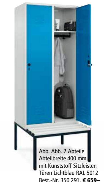
Abb. 2 Abteile Abteilleite 400 mm mit Kunststoff-Sitzleisten Türen Lichtblau RAL 5012 Best.-Nr. 350 291, € 659,-