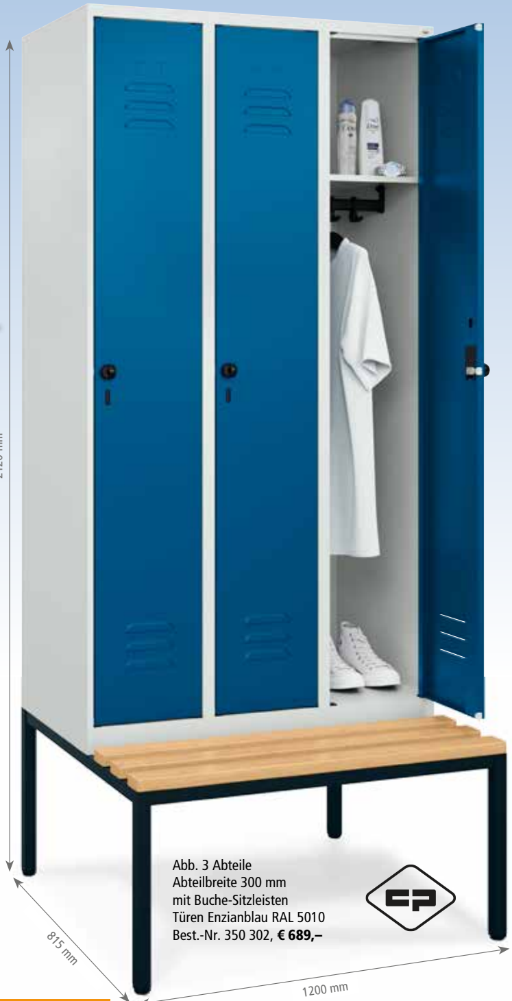
Abb. 3 Abteile Abteilleite 300 mm mit Buche-Sitzleisten Türen Enzianblau RAL 5010 Best.-Nr. 350 302, € 689,-

Detaillierte Schrankbeschreibung siehe Seite 768