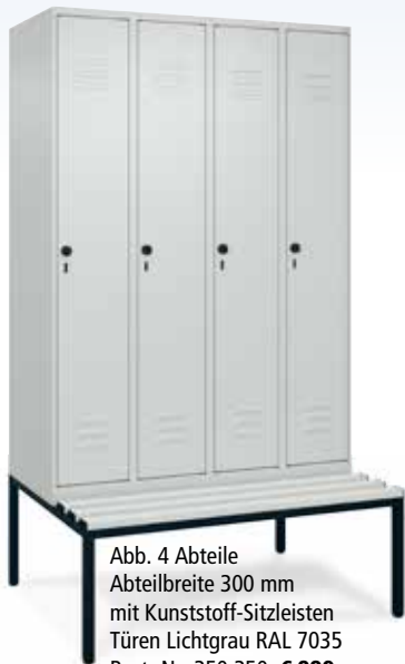
Abb. 4 Abteile Abteilleite 300 mm mit Kunststoff-Sitzleisten Türen Lichtgrau RAL 7035 Best.-Nr. 350 350, € 889,-