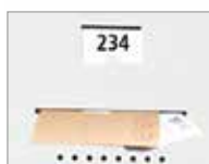
Inklusive Etikettenrahmen und Briefeinwurfslitz