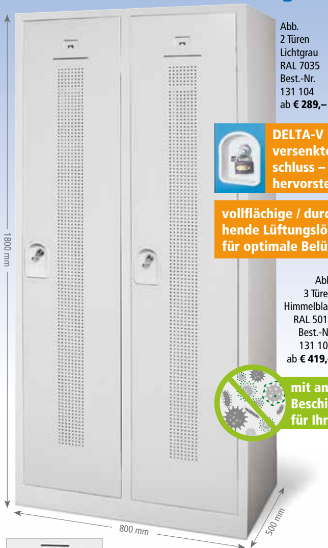
Abb. 2 Türen Lichtgrau RAL 7035 Best.-Nr. 131 104 ab € 289,-

SYSTEM SP1 mit Sockel und Drehriegelverschluss – Abteillbreite 400 mm