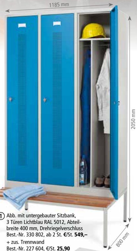
1 Abb. mit untergebauter Sitzbank, 3 Türen Lichtblau RAL 5012, Abteilleite 400 mm, Drehriegelverschluss Best.-Nr. 330 802, ab 2 St. €/St. 549,- + zus. Trennwand Best.-Nr. 227 604, €/St. 25,90