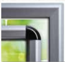
Ecken mit Gehrung oder abgerundet