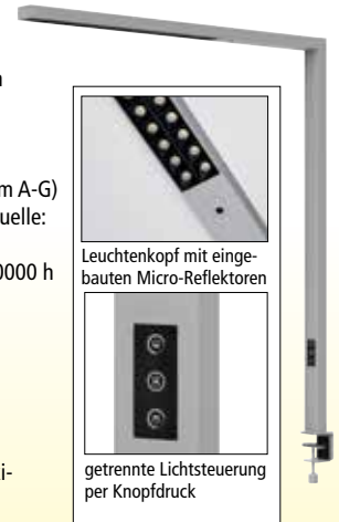
Leuchtenkopf mit eingebauten Micro-Reflektoren