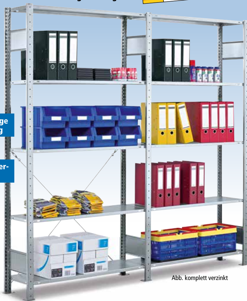
Abb. komplett verzinkt