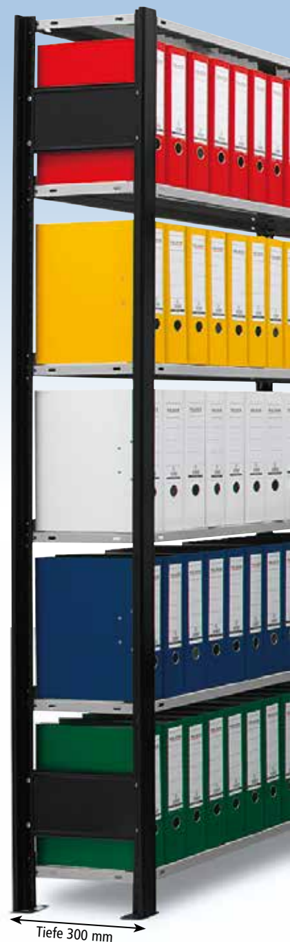
Tiefe 300 mm

Optimale Oberflächengüte verzinkt oder verzinkt und kunst- stoffbeschichtet