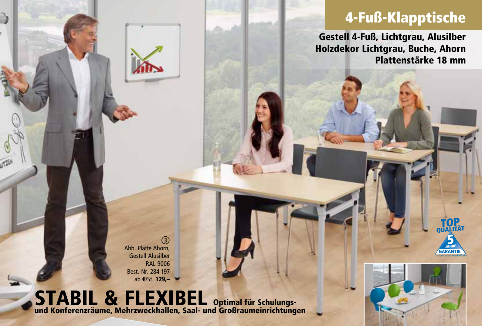
③ Abb. Platte Ahorn, Gestell Alusilber RAL 9006 Best.-Nr. 284 197 ab €/St. 129,-

Gestell 4-Fuß, Lichtgrau, Alusilber Holzdekor Lichtgrau, Buche, Ahorn Plattenstärke 18 mm