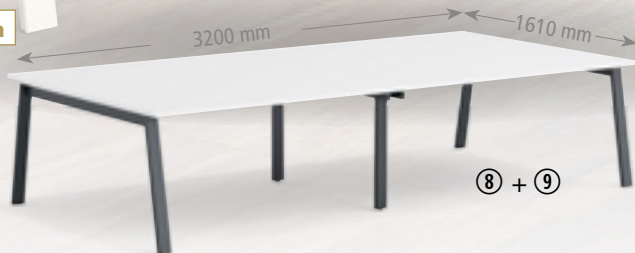
Abb. Tischkombination Weiss/Anthrazit ⑧ 1 x Best.-Nr. 352 798 ⑨ 1 x Best.-Nr. 352 816 €/St. 1.348,-