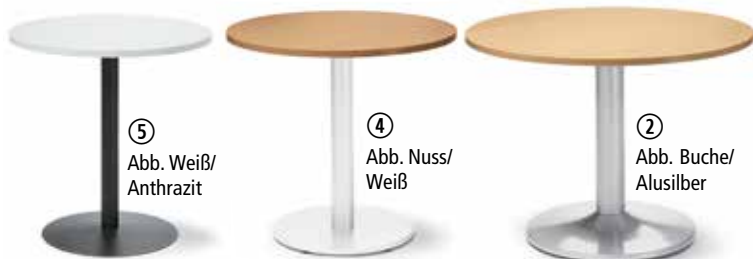
⑤ Abb. Weiß/ Anthrazit