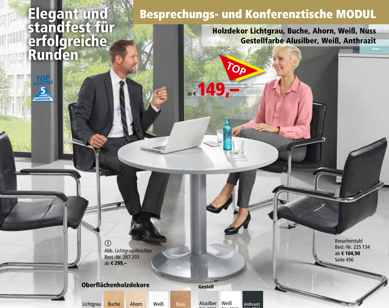
① Abb. Lichtgrau/Alusilber Best.-Nr. 267 203 ab € 299,-