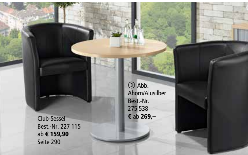
③ Abb. Ahorn/Alusilber Best.-Nr. 275 538 € ab 269,-