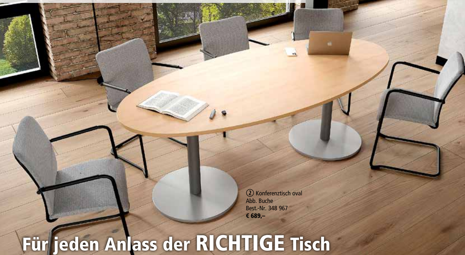
② Konferenztisch oval Abb. Buche Best.-Nr. 348 967 € 689,-

Holzdekor Lichtgrau, Buche, Ahorn, Weiß, Plattenstärke 25 mm Gestellfarbe Alusilber