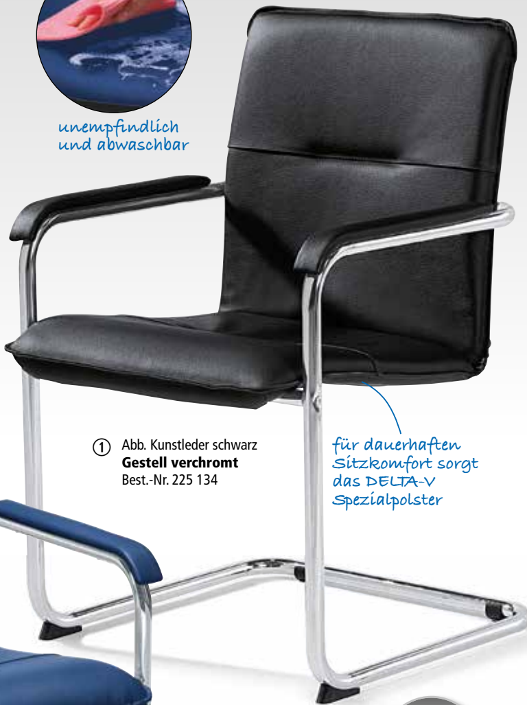
① Abb. Kunstleder schwarz Gestell verchromt Best.-Nr. 225 134