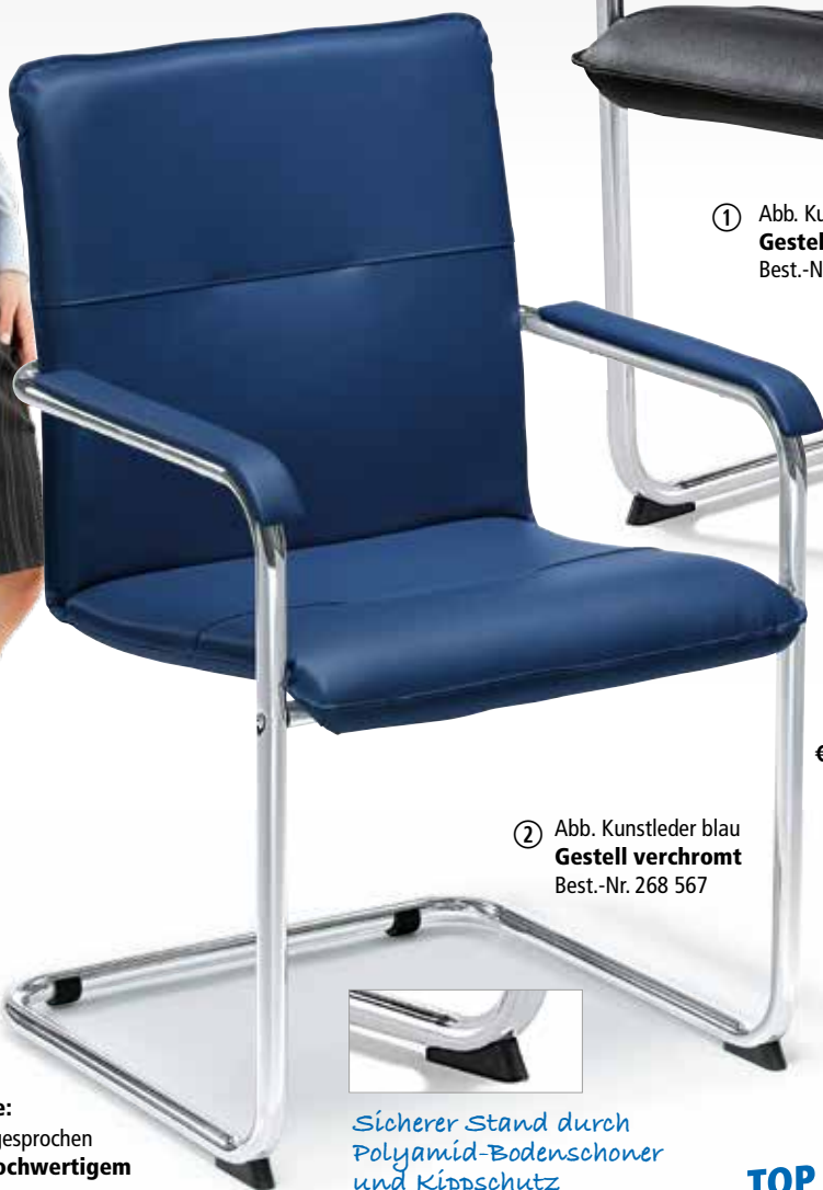
② Abb. Kunstleder blau Gestell verchromt Best.-Nr. 268 567