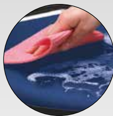
unempfindlich und abwaschbar

Schlichte Eleganz mit erstklassigem Sitzkomfort