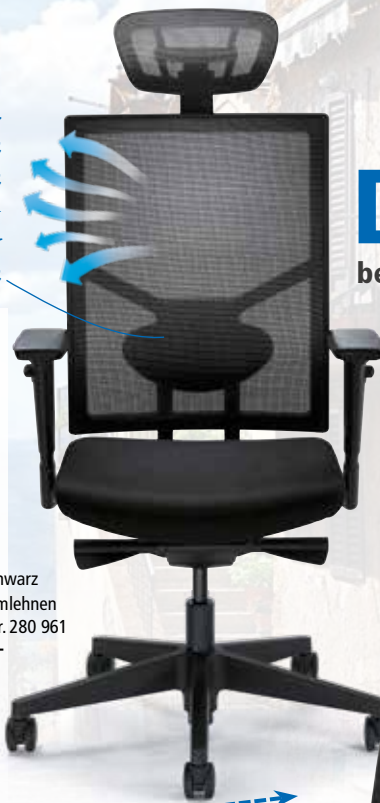
② Abb. schwarz inkl. Armlehnen Best.-Nr. 280 961 € 479,-

3-dimensional verstellbare Lordosenstütze für optimalen Halt der Wirbelsäule