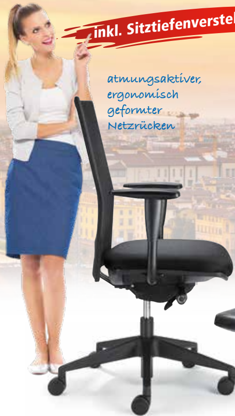
Abb. schwarz inkl. Armlehnen Best.-Nr. 272 112