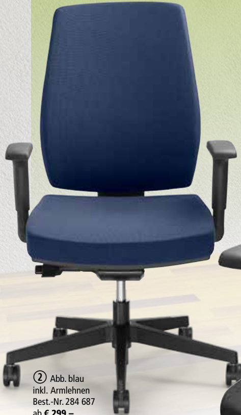
② Abb. blau inkl. Armlehnen Best.-Nr. 284 687 ab € 299,-