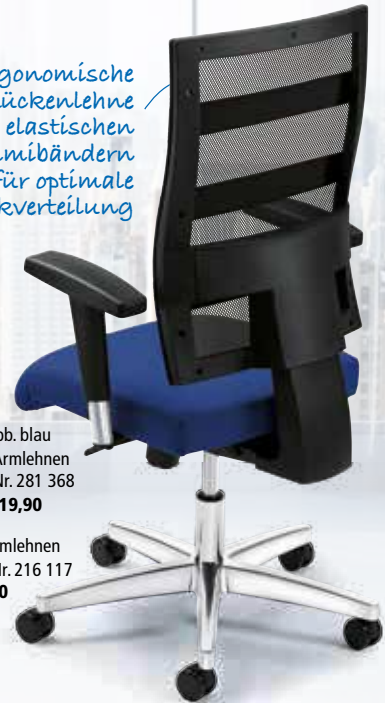
② Abb. blau ohne Armlehnen Best.-Nr. 281 368 ab € 219,90

ergonomische Netz-Rückenlehne mit elastischen Gummibändern für optimale Druckverteilung