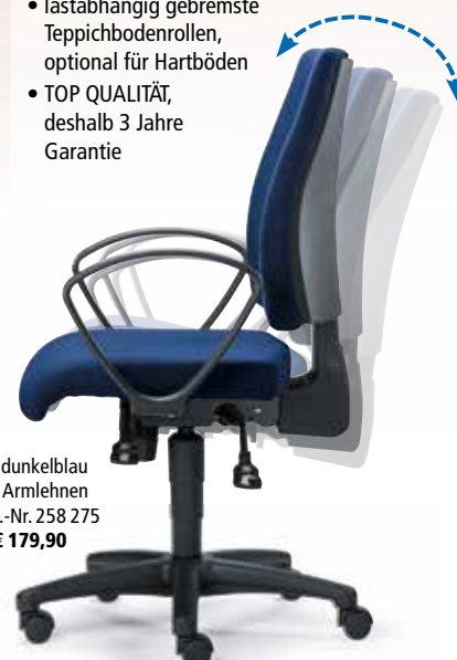
⑤ Abb. dunkelblau inkl. Armlehnen Best.-Nr. 258 275 ab € 179,90

Perfekter Komfort durch ergonomisch geformte Polsterung