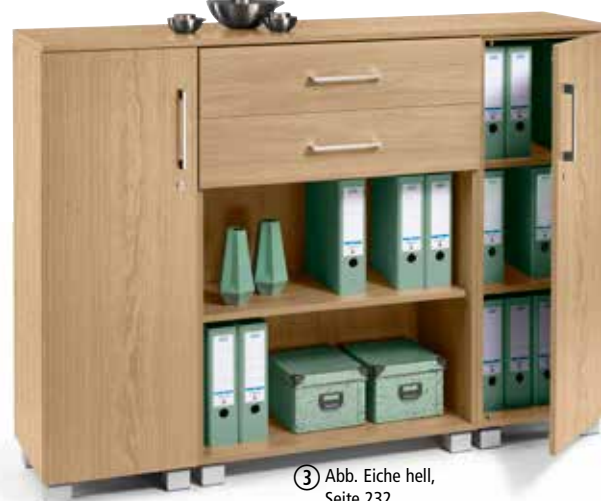
③ Abb. Eiche hell, Seite 232