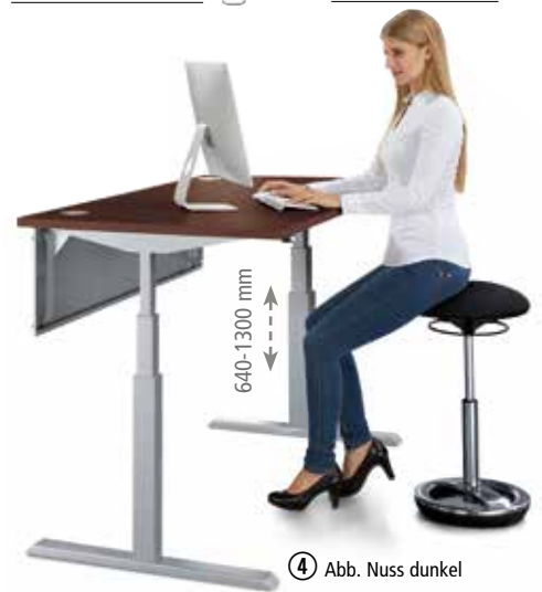
④ Abb. Nuss dunkel

Handschalter Memory 3 Höhen programmierbar, Digitalanzeige Best.-Nr. 329 736 €/St. 69,90