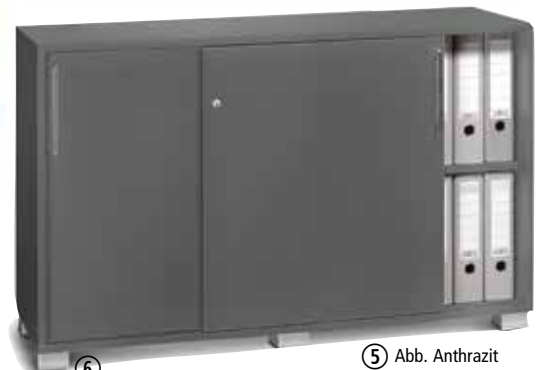
⑤ Abb. Anthrazit