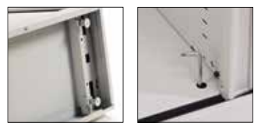
Verstärkter Sockel , mit 4 Bodenausgleichsschrauben, bequem von innen einstellbar