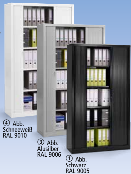
④ Abb. Schneeweiß RAL 9010 ③ Abb. Alusilber RAL 9006 ① Abb. Schwarz RAL 9005

Originalpreis 609,- TOP ab € 499,- Sie sparen bis zu 110,- €