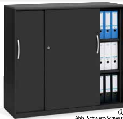
Abb. Schwarz/Schwarz ③