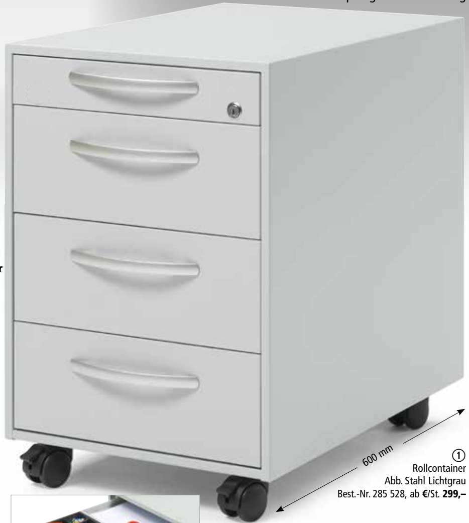
① Rollcontainer Abb. Stahl Lichtgrau Best.-Nr. 285 528, ab €/St. 299,-