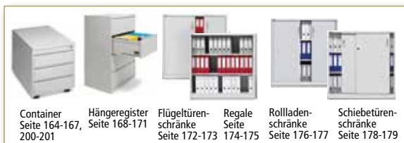
Container Seite 164-167, 200-201 | Hängeregister Seite 168-171 | Flügeltüren-schränke Seite 172-173 | Regale Seite 174-175 | Rollladen-schränke Seite 176-177 | Schiebetüren-schränke Seite 178-179