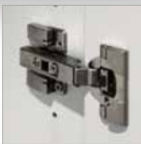
stabile Türbänder mit 110° Öffnungswinkel

⑦ Garderobenschrank Abb. Ahorn, 6 Ordnerhöhen Breite 1200 x Tiefe 420 mm Best.-Nr. 351 942, € 619,-