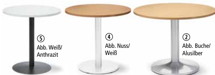
⑤ Abb. Weiß/ Anthrazit