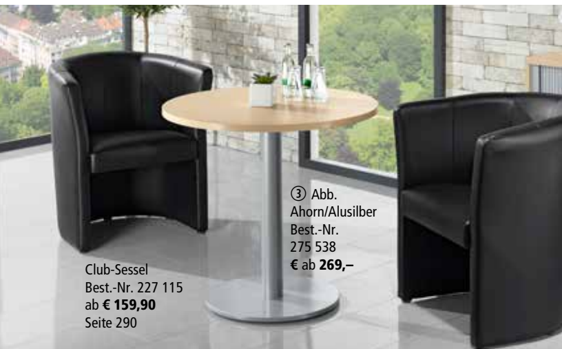
③ Abb. Ahorn/Alusilber Best.-Nr. 275 538 € ab 269,-