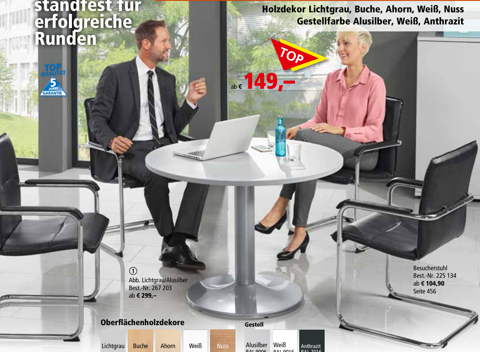
① Abb. Lichtgrau/Alusilber Best.-Nr. 267 203 ab € 299,-