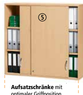
Aufsatzchränke mit optimaler Griffposition

Inklusive Premium-Lieferung PROFESSIONELL SCHNELLER AUFSTELL-SERVICE KOSTENFREI